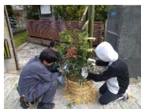
【門松の飾りつけの様子】