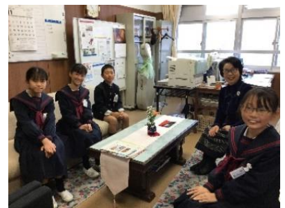
【門松づくりに参加した皆さん】