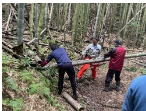
【竹の切り出しの様子】

12月8日には、その竹を使って、門松を作りました。飾りつけは大変でしたが、大変よいものができました。協力してくださった保護者の皆様、そして児童生徒の皆さん、本当にありがとうございました。