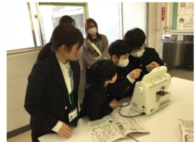
【ミシンの使い方を学んでいます】

参観日の後は、学校保健安全委員会を行いました。今年度は本学園児童生徒の健康状態の報告と、「簡単にできるバランスの取れた朝食づくり」を行いました。栄養教諭からの話の後、実際に朝食づくりをしながら、栄養バランスや食事量等について学びました。「こんなに簡単にできるんですね!」「簡単に美味しい!」などの声が聞かれました。御多用の中、御参加いただきありがとうございました。