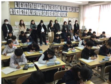
【しっかりとまとめています】

1月24日（金）に、小中同日参観日を行いました。子どもたちの成長した姿が見られたのではないのでしょうか。子どもたちは様々な関わりを通して大きく成長してきております。子どもたちの頑張りを認めしっかりと褒めていただけたらと思います。