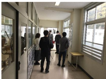
【距離をとりながら説得しています】

後半は各学級でKYT学習を行いました。危険予測学習（Kiken Yosoku Training）の頭文字をとってこのように呼んでいます。絵や写真を見て、それに潜む危険を予測し指摘し合うことで、実際に起こりそうな危険に気付き、事故に遭わないためにはどうすればよいかを考えることができました。