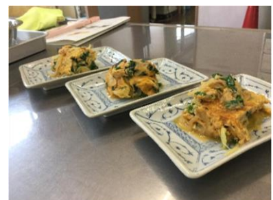
【おいしくできました!簡単!】