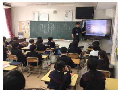
【危険を予測しています】