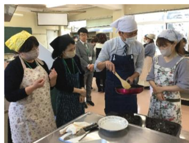
【栄養教諭がコツを教えています】