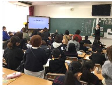
【保護者の皆さんと活動しています】