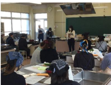
【養護教諭が説明しています】

参観日の後は、学校保健安全委員会を行いました。今年度は本学園児童生徒の健康状態の報告と、「簡単にできるバランスの取れた朝食づくり」を行いました。栄養教諭からの話の後、実際に朝食づくりをしながら、栄養バランスや食事量等について学びました。「こんなに簡単にできるんですね!」「簡単に美味しい!」などの声が聞かれました。御多用の中、御参加いただきありがとうございました。