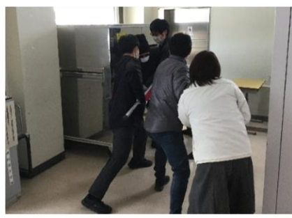
【不審者を取り押さえています】