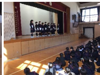
【新委員長任命の様子】