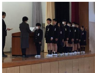
【功労賞授与の様子】

委員長としての責任を自覚し、委員会活動に率先して取り組む態度を育成するために実施しました。現委員長には功労賞を、新委員長には任命書を授与しました。授与された子どもたちは大変うれしそうでした。会に参加した全校児童も責任をもつことの大切さを感じることができました。来年度は、新委員長となる5年生を中心として、前期課程をさらに高めていってほしいと思います。