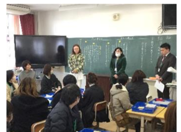
【評議員選出会の様子】

懇談後は、PTA執行部役員様が主体となり、PTA評議員選出会が行われました。会では、今年度のPTA評議員の皆様へ感謝の言葉をお伝えし、その後、来年度PTA評議員の選出を行いました。皆様のおかげで来年度の評議員も無事決まりました。執行部の皆様、今年度評議員の皆様、そして参加された皆様、御協力ありがとうございました。来年度評議員の皆様、どうぞよろしくお願いいたします。